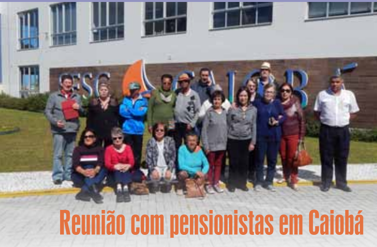
Reunião com pensionistas em Caiobá

A Assepan , com a colaboração da Fundação Sanepar, realizou em Caiobá nos dias 22 e 23 de agosto uma reunião agradável com as pensionistas da região. O encontro foi no SESC da cidade.