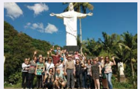
Vale dos Anjos em Rodeio SC - NOV /2017