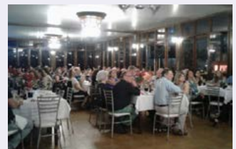
Jantar com aposentados e pensionistas da Regional de Curitiba em 08/12/17 no restaurante Cascatinha.